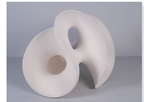
© Amalia Årfelt/BUS 2010. Lockelsen, måleri (2010).