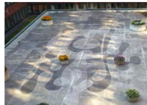
Pierre Olofsson, Utan titel , 1971. Fastighetsägare: Specialfastigheter Region Öst. © Pierre Olofsson/BUS 2008.

→ På norra innergården till Försvarmaktens byggnad på Lidingövägen i Stockholm finns Pierre Olofssons unika gestaltning på tak, väggar och mark färdigställd 1971. Konstverket har inte rengjorts på flera år och Statens konstråd informerades först 2008 om att fastigheten såldes till Specialfastigheter i början av 2000-talet.