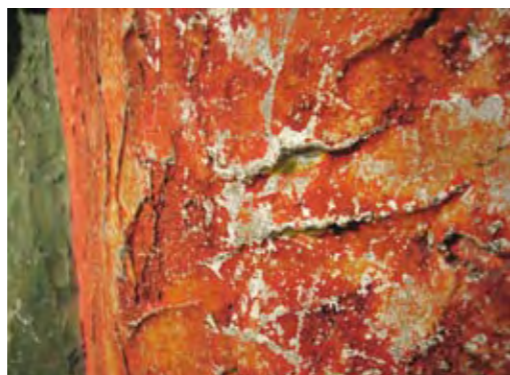
Olle Bonniér, Pelota , 1980.

Bilderna visar slitaget på konstverkets färgskikt.