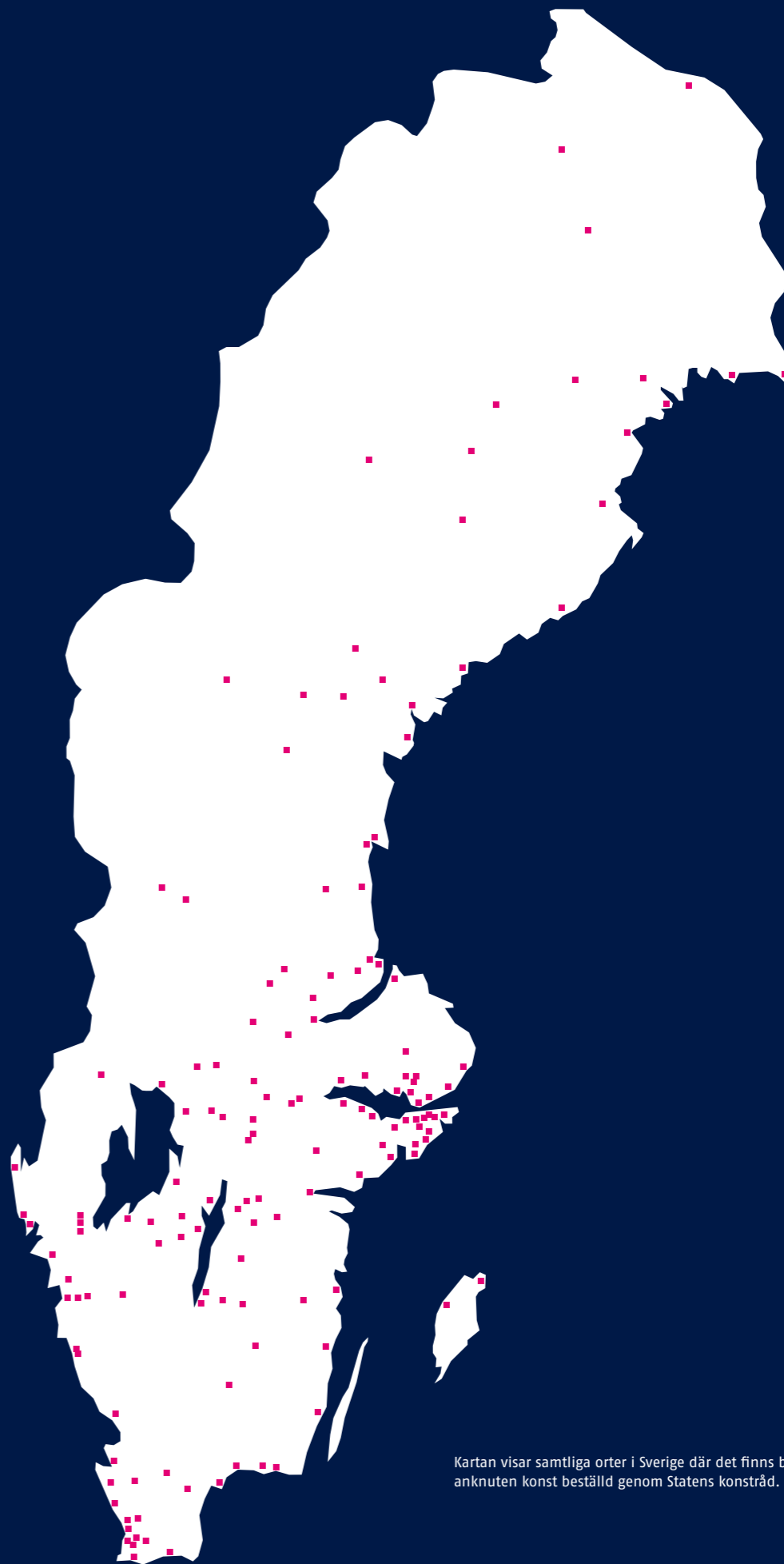
Kartan visar samtliga orter i Sverige där det finns byggnads-anknuten konst beställd genom Statens konstråd.