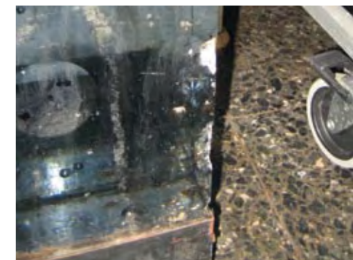
Sven Palmqvist, Elektronik contra stalaktit (motto) , 1969.

Översikt bilden visar konstverket strax efter invigningen. Detaljbilden är tagen 2007 och visar en del av de skador som har uppstått.