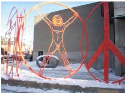
Ilhan Koman och Chet Kanra, Från Leonardo , 1971. Bilden visar konstverket efter renoveringen 2006. Fastighetsägare: Akademiska Hus Stockholm AB. © Ilhan Koman och Chet Kanra.

Ett konstverk som står utomhus och utsätts för olika klimat- och temperaturväxlingar behöver i regel åtgärdas efter ett visst antal år beroende på konstverkets material och tekniska utförande. Underhållsfrågor diskuteras alltid av Statens konstråds projektledare, anlitad konstnär och fastighetsägare när nya konstverk projekteras. Det är viktigt att belysa alla tänkbara risker för att kunna planera fastighetsägarens framtida underhåll av konstverket.