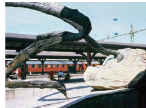
Claes Hake, Bohuslän , 1983.

Om ett verk har en extra utsatt placering kan det vara bra att förstärka konstverkets skydd genom exempelvis en övervakningskamera som kan förhindra vandalisering. Det är lätt att tro att vandalisering av offentlig konst är ofta förekommande. Under inventeringen har dock få fall av uppsåtlig vandalisering upptäckts.